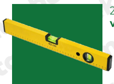
2. ábra vízmérték