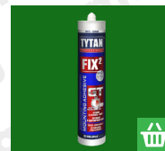
4. ábra Tytan Fix2 GT nagy szilárdságú építési ragasztó Megvásárolható webshopunkban!

A grillsütőt legalább 6 m távolságban kell felállítani a környező fáktól, bokroktól, valamint éghető anyagot tartalmazó építményektől! A biztonságos tűztávolságra használat közben is fokozottan ügyelj, tekintettel a szabadtéri tűzhasználatra!