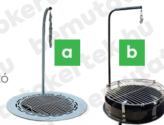
1. ábra: tartozék