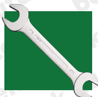
3. ábra villáskulcs